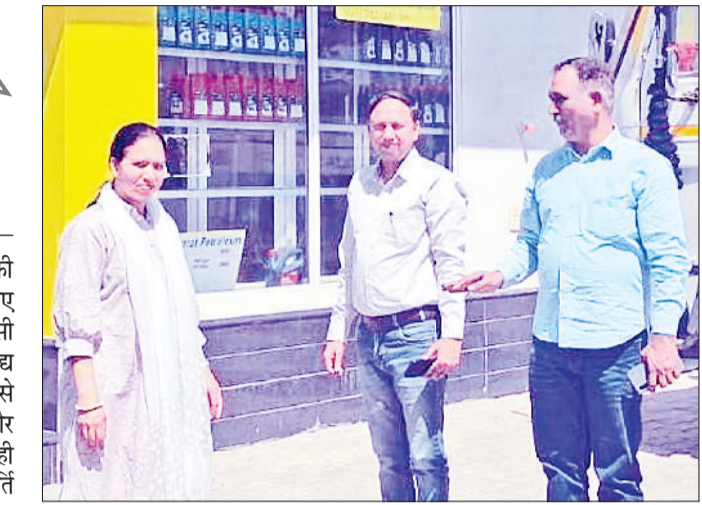
फतेहाबाद। पैट्रोल पंपों का निरीक्षण करते हुए जिला खाद्य एवं आपूर्ति विभाग के कर्मचारी।