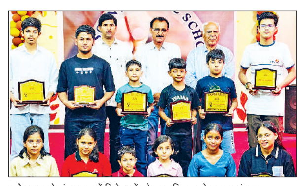
फतेहाबाद। फ्रेंसट स्कूल में विजेताओं को सम्मानित करते स्कूल प्रबंधक।