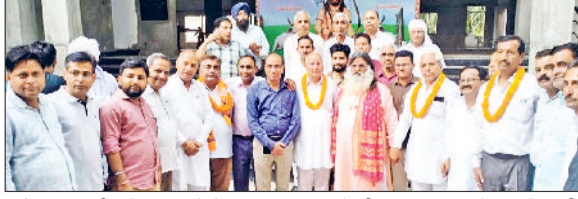
फतेहाबाद। जीत के बाद लोगों का आभार जताते श्री ब्राह्मण सभा के पदाधिकारी।