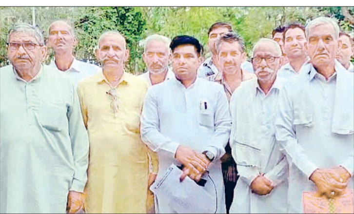
फतेहाबाद। एसडीएम से मिलने पहुंचे मताना के सरपंच व ग्रामीण। कलेक्टर रेट को लेकर डीसी को ज्ञापन सौंपते एसोसिएशन सदस्य।