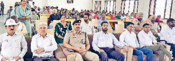
सिरसा। सेमिनार में भाग लेते विद्यार्थी।