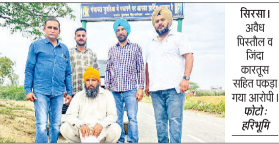
सिरसा। अवैध पिस्तौल व जिंदा कारतूस सहित पकड़ा गया आरोपी।

सिरसा पुलिस टीम ने गश्त व चैकिंग के दौरान रोड़ी थाना क्षेत्र के गांव सुरतिया से एक व्यक्ति को अवैध पिस्तौल व 3 जिंदा कारतूस सहित काबू किया है। नारकोटिक्स सेल सिरसा प्रभारी ने बताया कि सेल की एक पुलिस टीम गश्त व चैकिंग के दौरान गांव सुरतिया से होते हुए गांव फतामलुकी की ओर जा रही थी। इस दौरान पुलिस पार्टी जब गांव सुरतिया के नजदीकी गांव के जोहड़ के पास पहुंची तो सामने