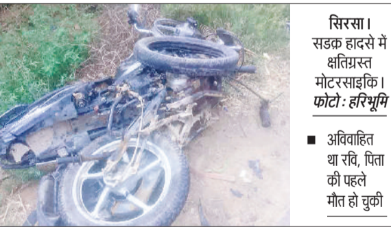
सिरसा। सड़क हादसे में क्षतिग्रस्त मोटरसाइकिल।

खंड के गांव नाथूसरी कलां के निकट सिरसा-भादरा रोड पर एक वाहन की टक्कर से मोटरसाइकिल सवार युवक की मौत हो गई। स्थानीय लोगों ने घायल युवक को चोपटा के पीएचसी में भर्ती कराया, जहां उसकी गंभीर हालत को देखते हुए डॉक्टरों ने उसे अग्रोहा मेडिकल