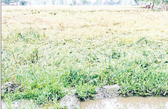
फतेहाबाद। बरसात व ओलावृष्टि से फसलों को हुआ नुकसान।

प्रदेश में पश्चिमी विक्षोभ के प्रभाव के चलते रविवार देर शाम को तेज बरसात व उसके बाद चली हवाओं से गेहूं की फसल को खासा नुकसान पहुंचा है। पककर तैयार खड़ी गेहूं की फसल जमीन पर बिछ गई है। इसके अलावा दर्जनभर गांवों में ओलावृष्टि से गेहूं व सरसों को नुकसान हुआ है। किसानों की कहना है कि गेहूं की फसल में 20 फीसदी से ज्यादा का नुकसान है। अनेक किसानों ने सोमवार सुबह डीसी से मिलकर 60 हजार रुपये प्रति एकड़ मुआवजा की मांग की है। सोमवार को भी पूरा दिन बादल छाये रहे और रूक-रूक कर बूंदबांदी होती रही। बता दें कि मौसम विभाग ने 28 से एक अप्रैल तक आंध्र व तेज बारिश की भविष्यवाणी कर रखी है। राजस्व विभाग के अनुसार बीते 24 घंटों में यहां 15 एमएम बरसात दर्ज की गई। तापमान 3 डिग्री गिरकर 30 तथा न्यूनतम तापमान 18 डिग्री तक पहुंच गया। बता दें कि एक सप्ताह पहले यहां तापमान 35 डिग्री तक पहुंच गया था वहीं न्यूनतम तापमान 19 डिग्री हो गया था। इसके बाद पश्चिमी विक्षोभ एक्टिव होने से