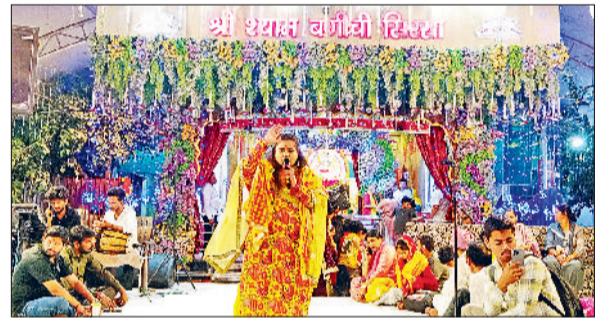
सिरसा। भजनों की प्रस्तुति देते भजन गायिका।