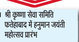
श्री कृष्णा सेवा समिति फतेहाबाद में हनुमान जयंती महोत्सव प्रारंभ