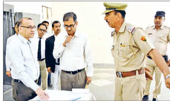
फतेहाबाद। ईवीएम-वीवीपैट वेयरहाउस का निरीक्षण करते जिला निवांचन अधिकारी एवं डीसी डॉ. विवेक भारती।

जिला निवांचन अधिकारी एवं डीसी डॉ. विवेक भारती ने सोमवार को संबंधित अधिकारियों व राजनीतिक दलों के प्रतिनिधियों के साथ लघु सचिवालय स्थित ईवीएम-वीवीपैट वेयरहाउस का निरीक्षण किया। डीसी ने निरीक्षण के दौरान सीसीटीवी व साफ-सफाई सहित समस्त सुरक्षा व्यवस्थाओं की बारीकी से जांच की। डीसी डॉ. विवेक भारती ने संबंधित